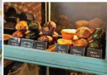
アンティークなショーケースの中に、その日の朝焼き上げたマフィンが並び、人気の抹茶味や季節の果物などを使ったものも、1個230円から