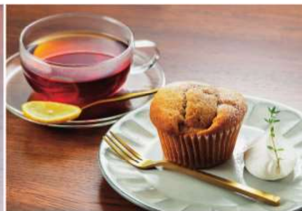
[アップルシナモンマフィン]2個80円にホットティー(アールグレイ400円)を添えて、ほんのりんごが利いたしっとり生地、りんごのさわやかな風味がアクセント