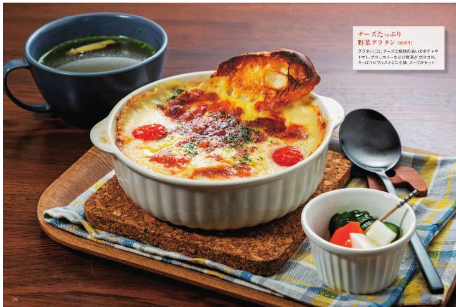
チーズたっぷり 野菜グラタン (980円) グラタンには、チーズと相性の良いカボチャやトマト、ブロッコリーなどの野菜がゴロゴロ、さっぱりピクルスとミニ小鉢、スープがセット