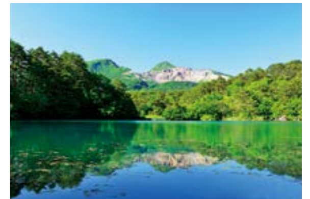
五色沼湖沼群最大の毘沙門沼。エメラルドグリーンの水面に雄大 な磐梯山を映す様は、まるで絵画のような美しさ